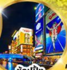
ช้อปปิ้ง ชินโซบาชิ

อิสระท่องเที่ยว 1 วันเต็ม วันอิสระเลือกชื่อ "Universal studio"