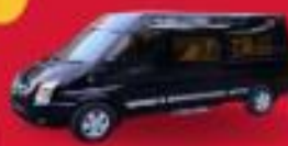
VAN (7-8 ที่นั่ง)

สำหรับท่านที่ต้องการความเป็นส่วนตัวมากขึ้น ท่านสามารถเลือกใช้บริการ รถส่วนตัวได้ โดยมีรูปแบบรถให้เลือกถึง 2 ประเภท โดยรถ แต่ละประเภท สามารถนั่งได้ตั้งแต่ 2 ท่านขึ้นไป