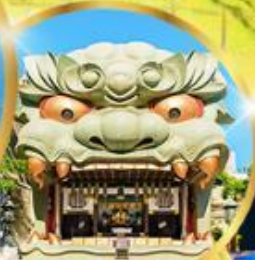
ศาลเจ้า นัมมะ ยาชากะ