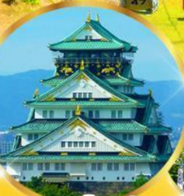
ปราสาทโอซาก้า