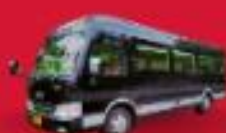
BUS (10-18 ที่นั่ง)