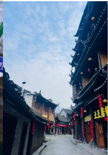
และของฝาก