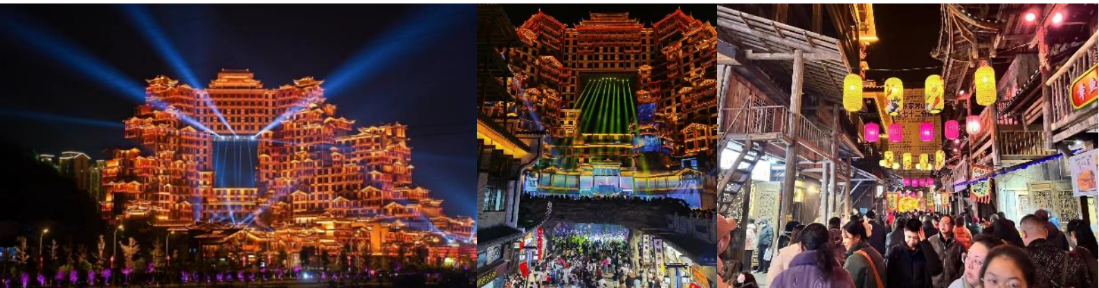
ของฝาก และอื่นๆ อีกมากมาย

Highlight! หากนับชั้นจริงๆ จะได้ทั้งหมด 36 ชั้น แต่ ที่บอกว่า 72 ชั้น คือแต่ละห้องจะมี 2 ชั้นนั่นเอง ..