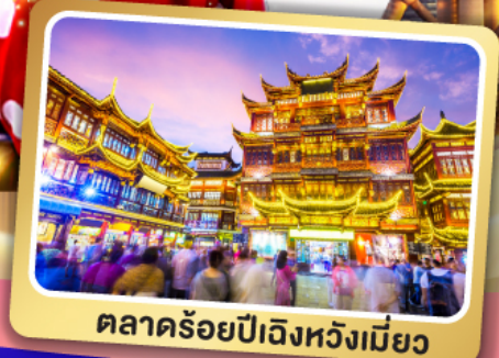
ตลาดร้อยปีเจิ้งหวงเมี่ยว