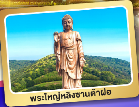
พระใหญ่หลังซานต้าฝอ