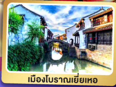
เมืองโบราณเยี่ยเหอ