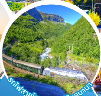
รถไฟสายโรแมนติกฟลัมสบานา