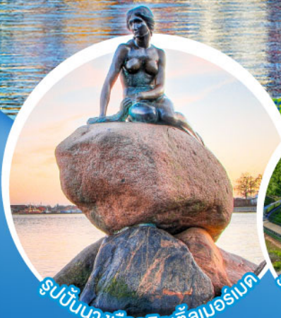
รูปปั้นนางเงือกลิตเติ้ลเบอร์เนต