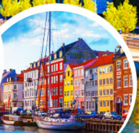
ท่าเรือฮาวน์ ไทเปเฮาเบ