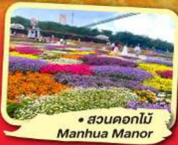
• สวนดอกไม้ Manhua Manor

ไม่ลงร้านช้อปปิ้ง พักโรงแรม 4-5 ดาว ชมโชว์ริเบต โชว์เปลี่ยนหน้ากาก