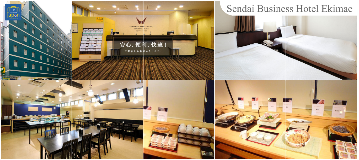
Sendai Business Hotel Ekimae