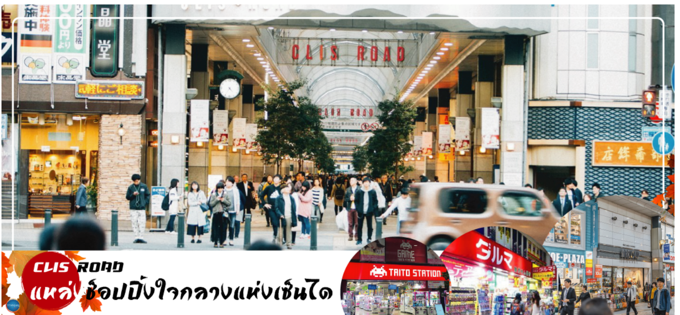
CLIS ROAD แหล่งช้อปปิ้งใจกลางแห่งเซนได

นำท่านสู่ ถนนคลิสโรด (Clis Road) ถนนสายช้อปปิ้งที่ใหญ่ที่สุดของเมือง มีสินค้าให้เลือกหลากหลายตั้งแต่อาหารท้องถิ่นหรือฟาสต์ฟู้ด ร้านคาเฟ่เก๋ ศูนย์เกมส์ ไปจนถึงแบรนด์เนมระดับไฮเอน HILIGHT!!! สำหรับย่านนี้คือ คาเฟ่ฟูกุโร (Fukuro Café) ตั้งอยู่ตึกที่อยู่หลังร้าน Gucci มีค่าเช่า 1,200 เยน ซึ่งราคานี้รวมกับค่าเครื่องดื่มแบบไม่อัน โดยจะมีนิกสูกที่ถูกฝึกจนเชี่ยวชาญหลากหลายสายพันธุ์ แต่ละตัวล้วนมีความน่ารักที่ต่างกันไป ที่สำคัญยังสามารถลูบหรือจับได้ภายในการดูแลของพนักงานผู้ชำนาญการ อีสระให้ท่านช้อปปิ้ง