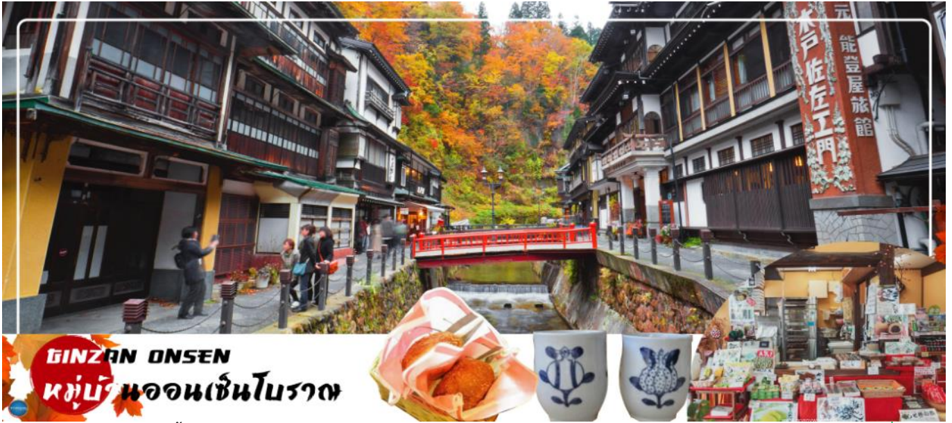
GINZAN ONSEN หมู่บ้านออนเซ็นโบราณ

จากนั้นนำท่านเดินทางสู่ กินซัง ออนเซ็น (Ginzan Onsen) (ใช้เวลาเดินทางประมาณ 2 ชั่วโมง) หมู่บ้านออนเซ็นเล็กๆกลางหุบเขา ประวัติดาวนานกว่า 100 ปี โดยหมู่บ้านนี้เดิมที เป็นหมู่บ้านเหมืองแร่มาก่อน หลังปิดการทำเหมืองไป ก็กลายมาเป็นหมู่บ้านออนเซ็นอย่างเดียว ที่นี่ประกอบด้วย เรียวกิงมากมายสไตล์ตะวันตกที่สร้างจากไม้หลายชั้น ได้รับการปลูกสร้างตั้งแต่ปลายสมัยไทโชถึงโชวะตอนต้น สามารถสัมผัสกับภูมิประเทศอันเป็นเอกลักษณ์ของบ้านเรือนยุคเก่า (ราคาไม่รวมค่าเช่าออนเซ็น ราคาอยู่ที่ 500-3000 เยน ทั้งนี้ขึ้นอยู่กับสถานที่บริการ)