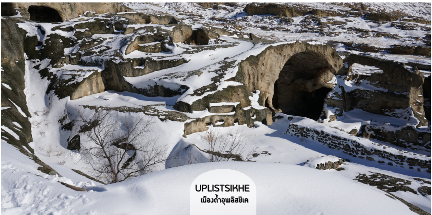
UPLISTSIKHE เมืองถ้ำอูปลิสซิค

ชมเมืองถ้ำโบราณอูปลิสซิค (Uplistsikhe) ตามภาษาจอร์เจีย แปลว่า “ป้อมปราการของขุนนาง” สัญลักษณ์ของความโบราณและความเป็นเอกลักษณ์ของจอร์เจีย อายุกว่า 3,000 ปีแล้ว เมืองนี้ใช้การสร้างโดยเจาะภูเขาหินจนลึกเข้าไปเป็นถ้ำ และมีการอยู่อาศัยกันจนเป็นชุมชนใหญ่ มีทั้งที่พักอาศัย ร้านค้า โบสถ์ คูๆ รอบๆ เมืองยังมีวิวเทือกเขา และแม่น้ำมิควารีที่สวยงามด้วยเมืองถ้ำ ทั้งหมดถูกสร้างขึ้นตั้งแต่สมัยต้นยุคเหล็ก จนถึงปลายยุคกลาง ที่ให้กลิ่นอายผสมผสานระหว่างวัฒนธรรมของดินแดนอนาโตเลียของตุรเคีย ผสมผสานกับดินแดนเปอร์เซียของอิหร่าน โดยนักโบราณคดีได้สันนิษฐานว่าที่นี่ถือเป็นแหล่งที่อยู่อาศัยที่เก่าแก่ที่สุดในประเทศ ปัจจุบันได้รับการขึ้นทะเบียนให้เป็นมรดกโลกโดยองค์การยูเนสโก