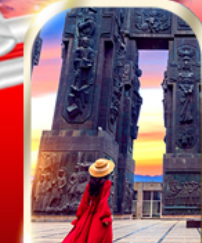
THE CHRONICLE OF GEORGIA