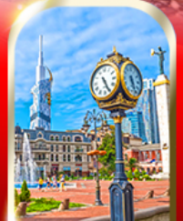
BATUMI CITY ADJARA

เมืองถ้ำอูปลิสซิค ■ ป้อมอนาบูรี ■ นั่งกระเช้าชมเมืองบอร์โจมิ อนุสาวรีย์มิตรภาพ รัสเซีย-จอร์เจีย ■ โบสถ์เกอร์เกดี วิหารจวารี ■ มหาวิหารสเวทิสคเวลี