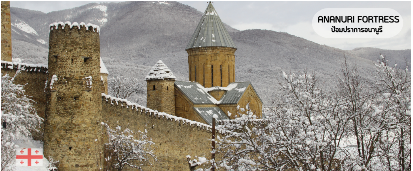
ANANURI FORTRESS ป้อมปราการอนานูรี