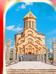
HOLY TRINITY CATHEDRAL