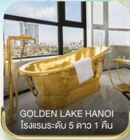
GOLDEN LAKE HANOI โรงแรมระดับ 5 ดาว 1 คืน