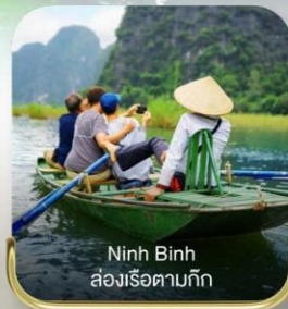
Ninh Binh ล่องเรือตามกีก