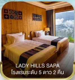
LADY HILLS SAPA โรงแรมระดับ 5 ดาว 2 คืน