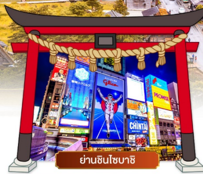
ย่านชินโซบาชิ