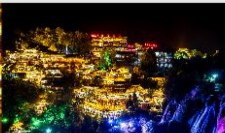
ฟูหรงเจิน