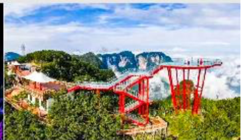
กูเขาเจ็ดดาว

*ทางบริษัทฯ ขอสงวนสิทธิ์ในการสลับโปรแกรมทัวร์ตามความเหมาะสมขึ้นอยู่กับสถานการณ์หน้างาน โดยคำนึงถึงผลประโยชน์ของลูกค้าเป็นสำคัญ