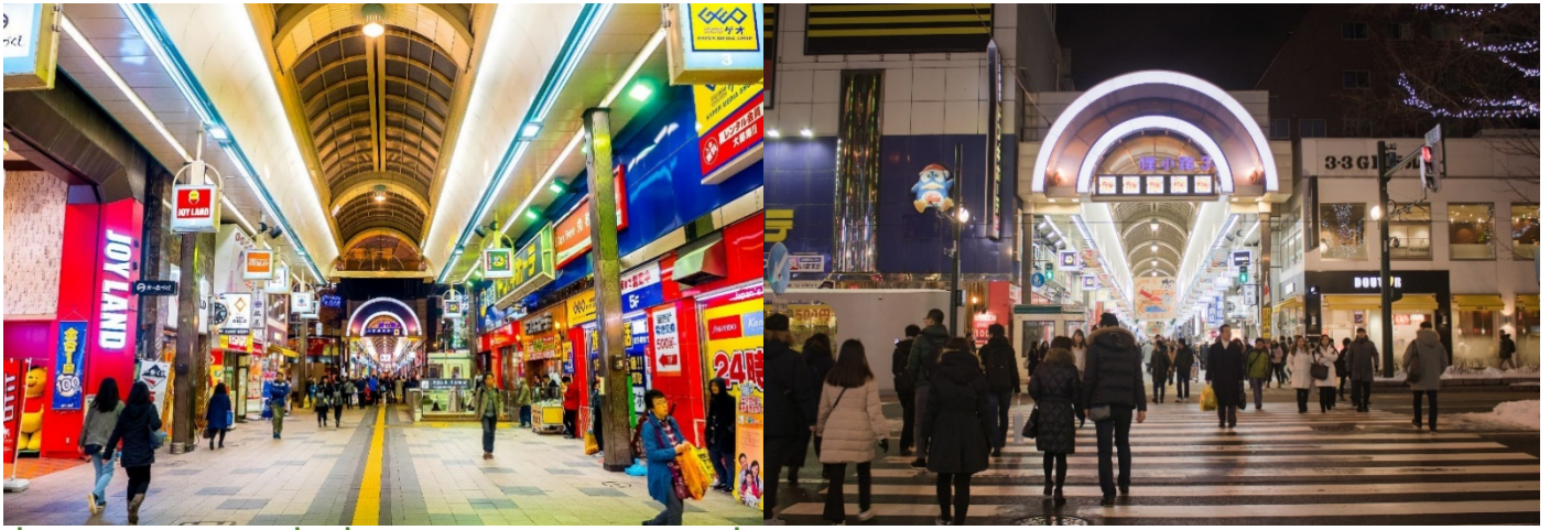
คำ อีสรอาหารคำเพื่อความสะดวกในการท่องเที่ยว พักที่ HOTEL ABEST SAPPORO, SAPPORO หรือเทียบเท่า