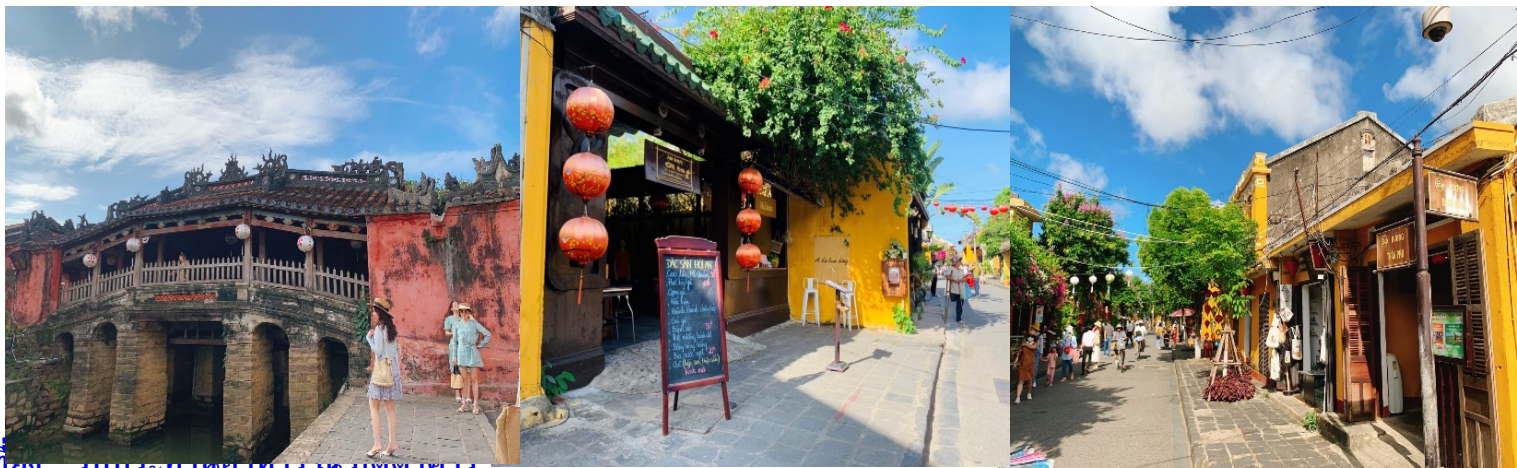
เพื่อชมบรรยากาศของเมืองโบราณฮอยอัน

นำท่านชม หมู่บ้านแกะสลักหินอ่อน ซึ่งเป็นหมู่บ้านแห่งหนึ่งอยู่ในตัวเมืองดานังที่มีชื่อเสียงโด่งดังไปทั่วโลกในเรื่องงานฝีมือ การแกะสลักหินอ่อน หินหยก ท่านสามารถบันทึกภาพหรือซื้องานแกะสลักเหล่านี้เพื่อเอากลับไปเป็นของฝาก หรือซื้อกลับไปเป็นของประดับในบ้าน