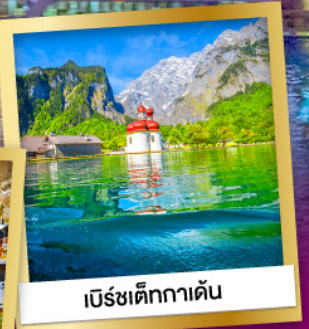
เบิร์ชเต็กกาเดิน