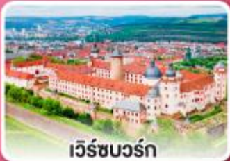
เวิร์ชบวร์ค