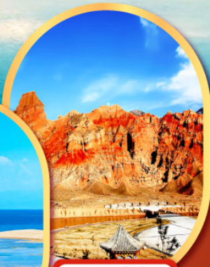
หุบเขาห้าสี อุทยานธรณีกุ้ยเต๋อ