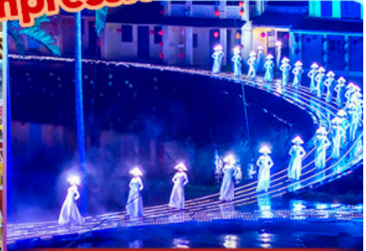
Hoi An Impression Show