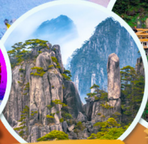
ภูเขาทองซาน