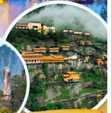
หมู่บ้านเทวดา

เมนูพิเศษ!! เปิดปากกึ่ง หมูแดง ปลาหมักเบียร์อภัย