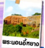
พระนอนอภัย