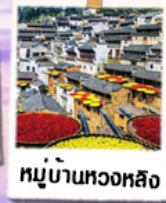
หมู่บ้านทอผ้า