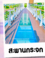
สปาธรรมชาติ