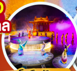
ชมโชว์อุทนีโจว