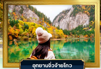
อุทยานจี๋จ้ายโกว