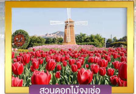
สวนดอกไม้จางเซอ