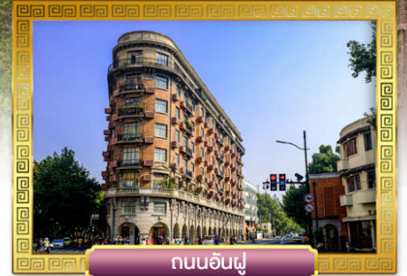
ถนนอันฝู