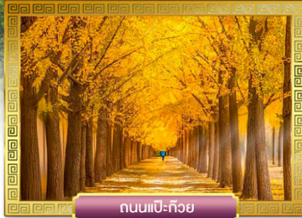
ถนนแปะก๊วย