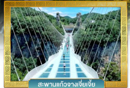
สะพานแก้วจางเจียเจี๋ย

เดินทางโดย: สายการบินเวียดนามแอร์ไลน์ (VZ)