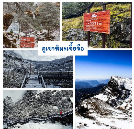
ภูเขาหิมะเจียวจื่อ

นำท่านเดินทางสู่ ภูเขาหิมะเจียวจื่อ (รวมรถเบตเตอร์+ กระเช้า) ใช้เวลาเดินทางประมาณ 2 ชั่วโมง ภูเขาหิมะแห่ง เมืองคุนหมิง สถานที่ท่องเที่ยวแห่งใหม่ของมณฑลยูนนาน ตั้งอยู่ทางภาคเหนือของเมืองคุนหมิง ระยะทาง 250 กิโลเมตร นำท่านนั่งกระเช้าขึ้นสู่ด้านบนของภูเขา ที่ระดับความสูง 4,223เมตร เหนือระดับน้ำทะเล ฤดูหนาว ระหว่างเดือน พฤศจิกายน -มีนาคมมีหิมะปกคลุมทั้งภูเขา ระหว่างทาง ท่านจะได้พบ สิ่งมหัศจรรย์มากมาย อาทิเช่น หิมะที่เกาะบน ต้นไม้ และน้ำตกบนหน้าผาที่จับตัวเป็นน้ำแข็ง ลำธาร รูปทรง ต่าง ๆ เป็นต้น ในฤดูใบไม้ผลิและฤดูร้อน ระหว่างเดือน พฤษภาคม-กันยายน ดอกไม้นานาพรรณพร้อมที่จะบาน สะพรั่งมากกว่า 30 ชนิด โดยเฉพาะกุหลาบพันปีนับหมื่นต้น ทวยอยบานตั้งแต่เชิงเขาถึงยอดเขา และในช่วงแต่ถ้าจะดู สีสันที่สวยงามที่สุดก็ต้องช่วงฤดูใบไม้เปลี่ยนสี ประมาณเดือนตุลาคม – เดือนพฤศจิกายน