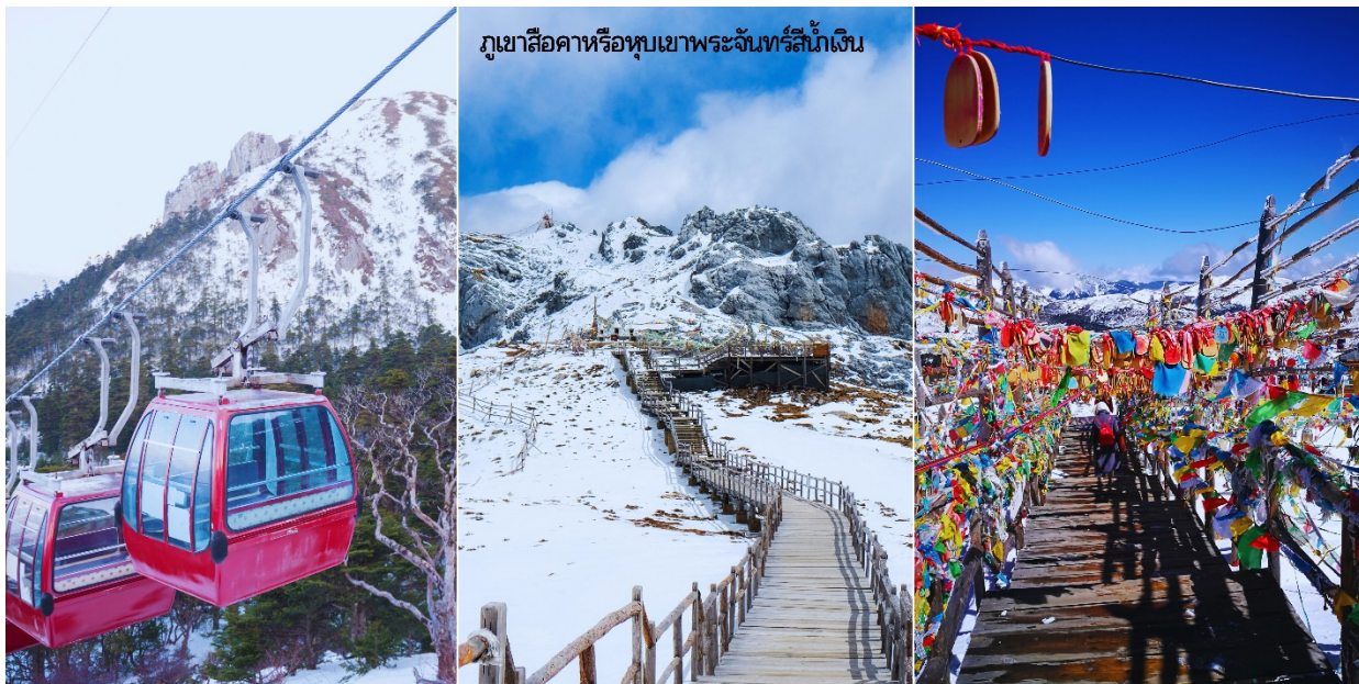
ภูเขาสีช่าหรือหุบเขาพระจันทร์สีน้ำเงิน

URGENT! เส้นทางนี้...เดินทางสู่พื้นที่สูงมากกว่า 2,500 เมตรจากระดับน้ำทะเล เนื่องจากมีความดันอากาศและออกซิเจนลดลง อาจเกิดการแพ้ที่ราบสูงได้ หากมีอาการรุนแรงรีบแจ้ง ไกด์หรือหัวหน้าทัวร์