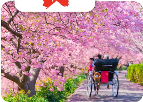
📅 กุมภาพันธ์ - มีนาคม 2568