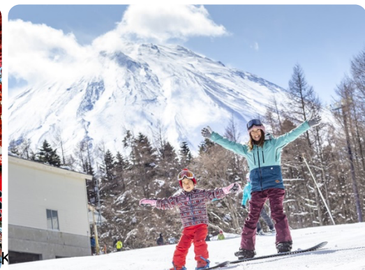
เริ่มต้น 55,990 บาท