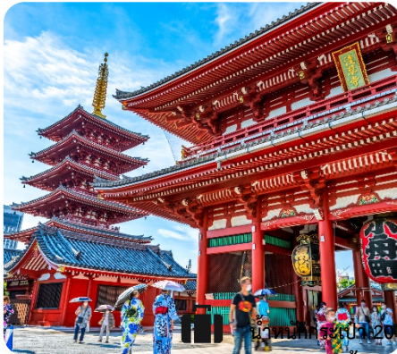
🍴 อาหาร 7 มื้อ