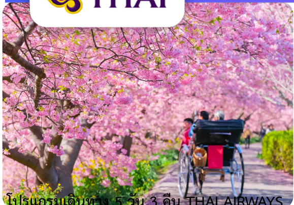
โปรแกรมเดินทาง 5 วัน 3 คืน THAI AIRWAYS