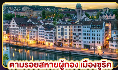
ตามรอยสหายผู้ทอง เมืองซูริค