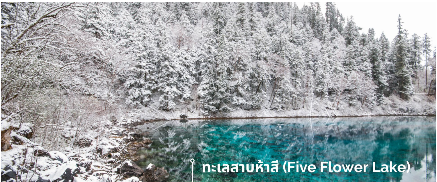
ทะเลสาบห้าสี (Five Flower Lake)

หนึ่งในจุดที่สวยงามและนักท่องเที่ยวแวะมาเยี่ยมชมเยอะที่สุด ตั้งอยู่ที่ความสูงเหนือระดับน้ำทะเลประมาณ 2,472 เมตร น้ำลึกประมาณ 5 เมตร น้ำใสจนเห็นพื้นด้านล่างของทะเลสาบ สีของผิวน้ำสวยงามแปลกตา โดยเฉพาะเมื่อยามแสงอาทิตย์สาดส่องกระทบผิวน้ำ สีของน้ำในทะเลสาบจะสะท้อนเป็นสีส้มถึง 5 เฉดสี สวยงามสะกดตา ซึ่งสาเหตุที่ทำให้เกิดสีส้มต่างๆ นี้มาจากการสะสมของแร่ธาตุ และพืชน้ำชนิดต่างๆ โดยจะมีสีส้มแตกต่างกันไปตามฤดูกาลและ