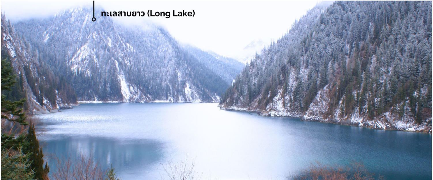
ทะเลสาบยาว (Long Lake)

ทะเลสาบที่ใหญ่ที่สุด สูงที่สุด และลึกที่สุดในจิวจ้ายโกว ด้วยเนื้อที่กว่า 581 ไร่ ความยาวกว่า 7 กิโลเมตร และลึกถึง 103 เมตร ทอดตัวโค้งเป็นรูปพระจันทร์เสี้ยว เนื่องจากหิมะบนภูเขาละลายลงมา น้ำในทะเลสาบสีฟ้าสวยงาม ล้อมรอบด้วยยอดเขาสูงชัน และต้นไม้เขียวใหญ่ที่ปกคลุมด้วยหิมะ งดงามราวหลุดออกมาจากภาพวาด ความพิเศษในช่วงฤดูหนาว ทะเลสาบจะกลายเป็นน้ำแข็งหนากว่า 60 เซนติเมตร ทำให้นักท่องเที่ยวนิยมมาเล่นสเก็ตน้ำแข็งกันเป็นจำนวนมาก