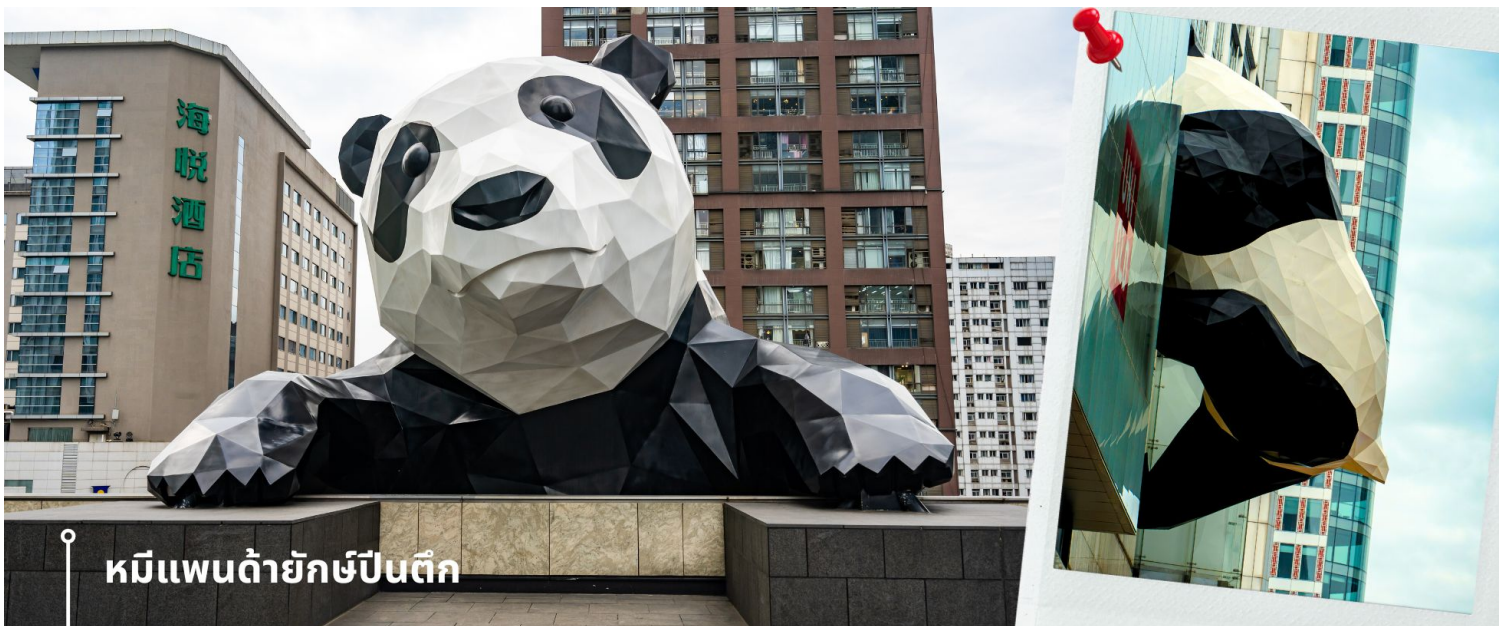
หมีแพนด้ายักษ์ป็นติก

จากนั้นนำท่านชมความน่ารัก อันเป็นเอกลักษณ์ของมหานครเฉิงตู นั่นคือ หมีแพนด้ายักษ์ป็นติก ประติมากรรมที่ชื่อว่า "I Am Here" ซึ่งเป็นหมีแพนด้ายักษ์ที่ตั้งอยู่ที่ IFS (International Finance Square) ในเมืองเฉิงตู ประติมากรรมนี้มี