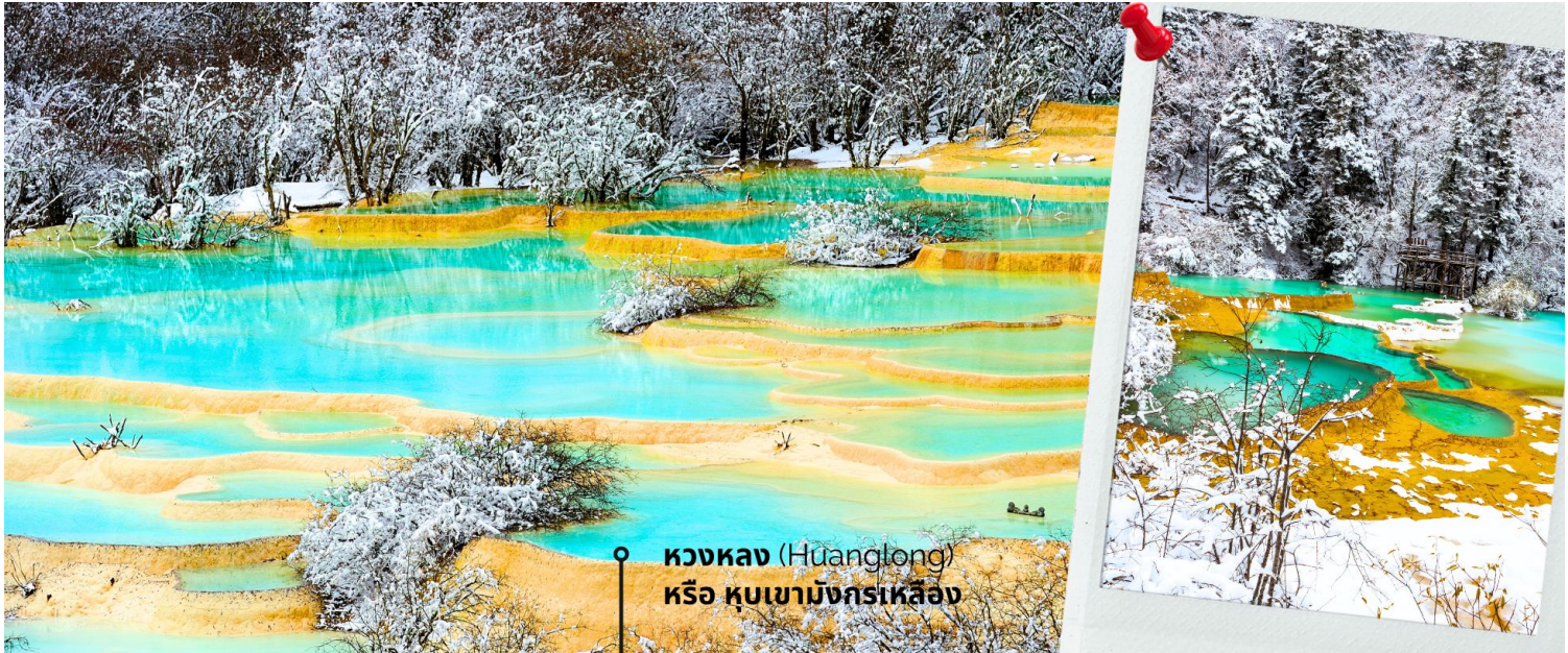
หวงหลง (Huanglong) หรือ หุบเขามังกรเหลือง

ทวงหลง (Huanglong) หรือ หุบเขามังกรเหลือง (รวมค่ากระเช้าขึ้น-ลง ทวงหลงและรถแบตเตอรี่) ที่ได้รับการขึ้นทะเบียนเป็นมรดกโลก รายล้อมไปด้วยแอ่งน้ำสีฟ้าจำนวนมากไม่ถ้วน และภูเขาสูงใหญ่สลับซับซ้อน อุทยานทวงหลง (Huanglong Scenic and Historic Interest Area) หรือ หุบเขามังกรเหลือง แหล่งธรรมชาติที่อุดมสมบูรณ์บนเทือกเขา Minshan Mountains มีระบบนิเวศที่หลากหลาย ทั้งน้ำพุร้อน น้ำตก แอ่งน้ำหินปูน รวมถึงเป็นแหล่งของพืชพรรณนานาชนิด และสัตว์ป่าใกล้สูญพันธุ์อย่าง แพนด้ายักษ์ และ ลิงจุกเขดสีทอง เป็นต้น ที่สำคัญยังมีทัศนียภาพที่สวยงามที่ราวกับเป็นดินแดนสวรรค์ ด้วยคุณสมบัติเหล่านี้ อุทยานทวงหลงจึงได้รับการขึ้นทะเบียนเป็นมรดกโลกโดย