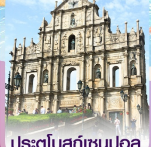
ประตูโบสถ์เซนต์ปอล