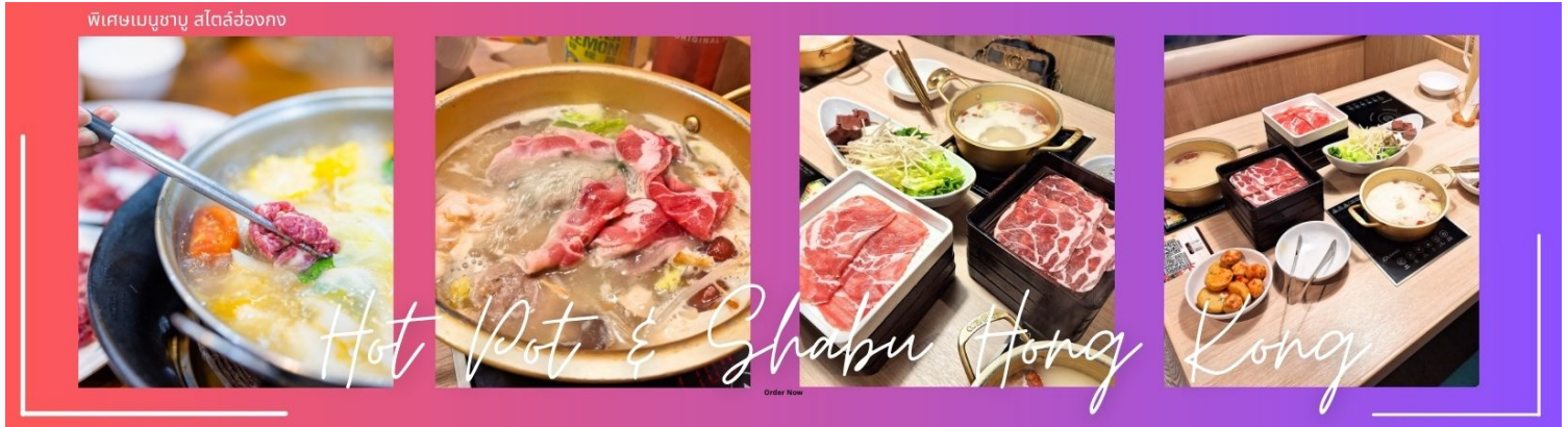
กลางวัน ๑๐๑ บริการอาหารกลางวัน ณ ภัตตาคาร พิเศษ เมนูชาบู สไตล์ฮ่องกง (6)

จากนั้นนำท่านชม โรงงานจิวเวอรี่ ซึ่งเป็นโรงงานที่มีชื่อเสียงที่สุดของฮ่องกงในเรื่องการออกแบบเครื่องประดับ อาทิเช่น จี้ และแหวนกำหั้น ที่สวยงามโดดเด่นไม่เหมือนใคร ซึ่งถือกำเนิดขึ้นที่นี่และมีชื่อเสียงที่สุดใช้เป็นเครื่องประดับติดตัว และเสริมดวงชะตา สินค้าทุกชิ้นมีเอกสารรับประกันคุณภาพเปลี่ยน ซ่อม ได้ตลอดอายุการใช้งาน หากเกิดการชำรุดจาก สินค้าไม่ใช่อุบัติเหตุ และนำท่านเลือกซื้อ เครื่องประดับที่ ร้านหยก ซึ่งคนจีนนั้นถือว่าหยกเป็นหิน ที่เป็นตัวแทนของ ความสวยงามและความบริสุทธิ์ มีความเชื่อว่าหยกมงคล ถ้าพกติดตัวไว้จะอายุยืนและสุขภาพดี