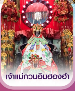
เจ้าแม่กวนอิมชองซ่า

✈️ คอนเฟิร์มออกเดินทาง ✈️ ทุกพีเรียด 2 ท่านขึ้นไป