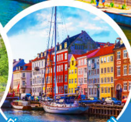
ท่าเรือบูฮาวน์ ไทเปเฮเกน