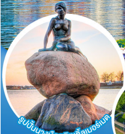
รูปปั้นนางเงือกลิตเติลเมอร์เมด