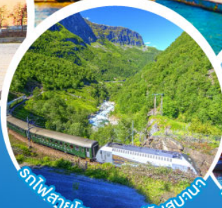
รถไฟสายโรแมนติกฟลินส์บานา