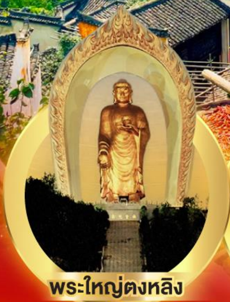
พระใหญ่ตงหลิง