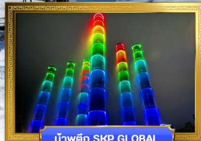
น้ำพุตึก SKP GLOBAL