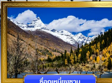
ชื่อภูเขาหิมะชาน