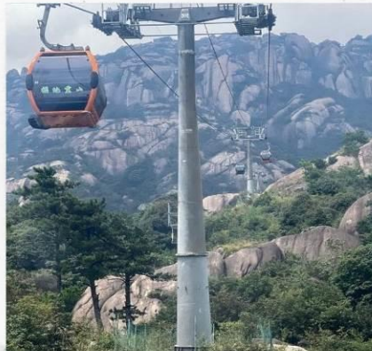
เขาลิงซาน