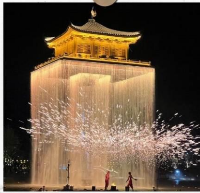
แสงไฟอุ๊นวีโจว