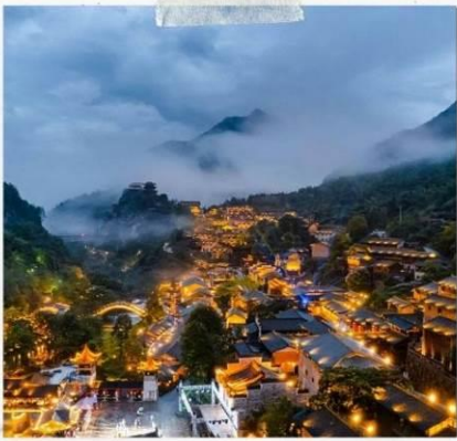
หุบเขาวังเซียนกู่