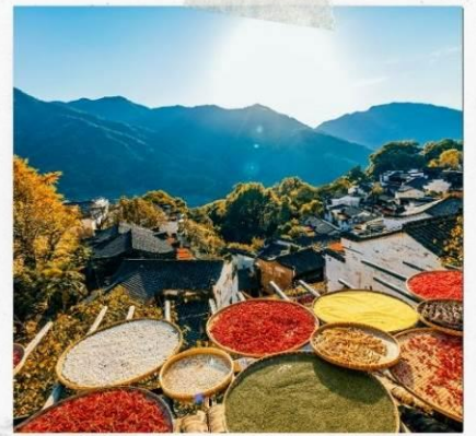
หมู่บ้านหวงลิ่ง