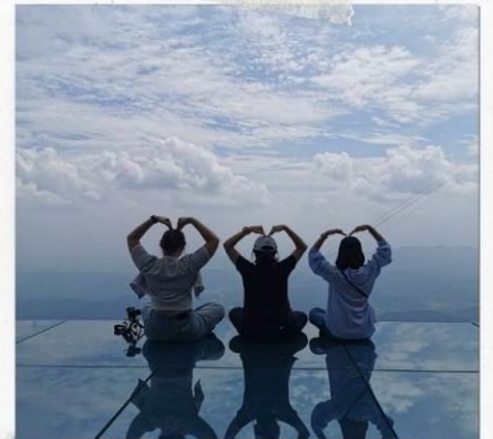
กระจกแห่งท้องฟ้า