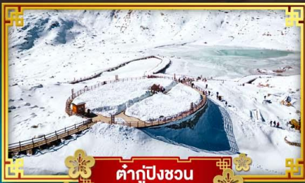
ต้ากู่ปิงชว่น