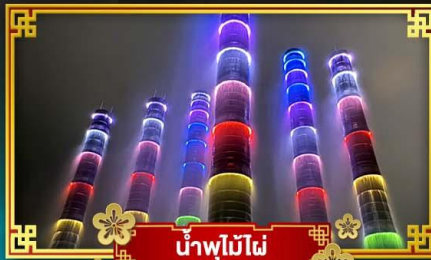
น้ำพุไม้ไฟ