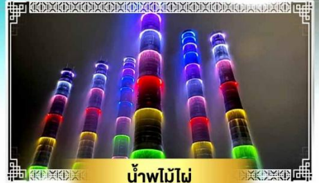
น้ำพุไม้ไฟ