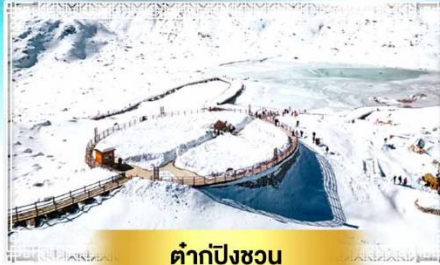
ต้ากู่ปิงชวน