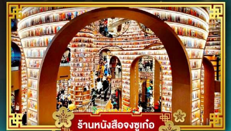
ร้านหนังสือจุกเก๋