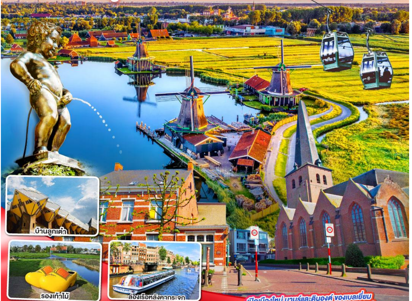
บ้านลูกเต่า

นามูร์ ดินองต์ บารส์-นัสซา บารส์-เฮร์ตโก