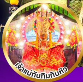
เจ้าแม่ทับทิมทับทิมทิว