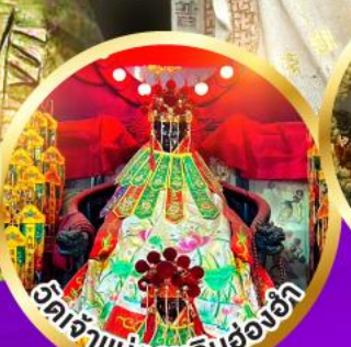
อิตเจ้าแม่กวนอิมอ่องอ่า