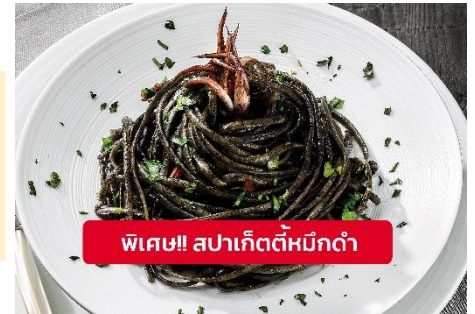
พิเศษ!! สปาเก็ตตี้หมึกดำ

Highlight ! เมื่อเยือนเกาะเวนิส เมนูที่ขึ้นชื่อและหากได้มาต้องได้ลิ้มลอง สปาเก็ตตี้ผัดซอสหมึกดำที่คลุกเคล้ากับความหอมนุ่มนวลกับบรรยากาศสุดคลาสสิคฉบับอิตาเลียนต้นตำรับเวนิส