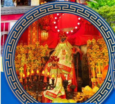
วัดเจ้าแม่กวนอิมสองอ้า