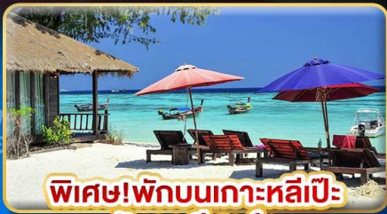
พิเศษ! พักบนเกาะหลีเป๊ะ อันดามัน รีสอร์ท