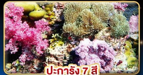
ปะการัง 7 สี