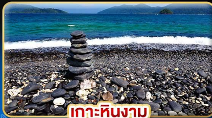
เกาะหินงาม