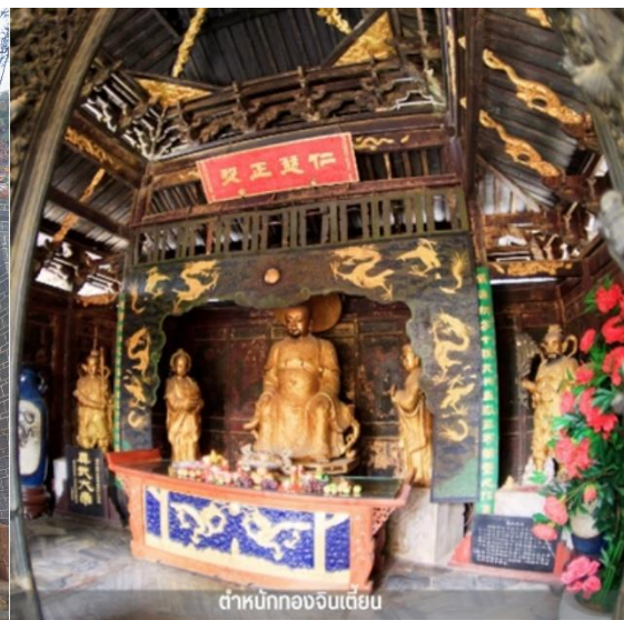
ดำนักทองจินเตียน