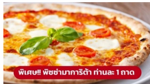
พิเศษ!! พิซซ่ามาการิตต้า ท่านละ 1 ถาด

เป็นมหาวิหารที่ใหญ่เป็นอันดับสองของโลกและรูปแบบการสร้างสถาปัตยกรรมแบบกอธิคที่ใหญ่ที่สุดในโลก มียอดแหลมบนหลังคา มากถึง 135 ยอด จนได้รับฉายาว่า "วิหารเม่น" บนยอดที่สูงที่สุดมีรูปปั้นทองขนาด 4 เมตร ของพระแม่มาดอนน่า