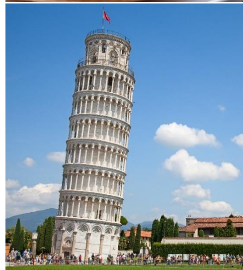
Highlight ! หอเอนปิซ่าเคยเป็นสถานที่กาลิเลโอมาพิสูจน์เรื่องแรงโน้มถ่วงของโลกและการตกของวัตถุ