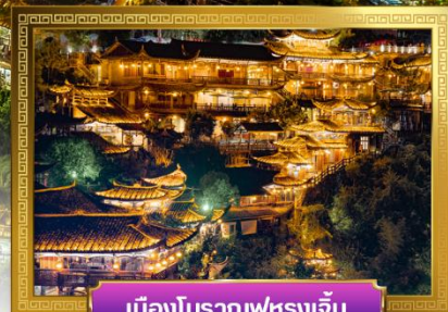
เมืองโบราณฟูหลงจิน