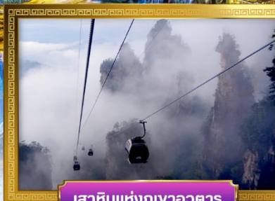
เสาคิんとแห่งภูเขาอวตาร