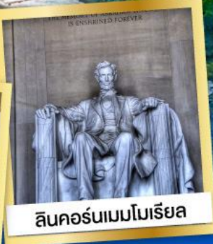
ลินคอล์นเมมโมเรียล