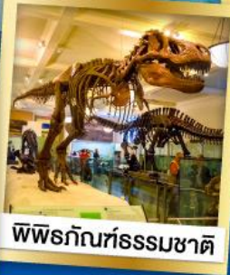
พิพิธภัณฑ์ธรรมชาติ