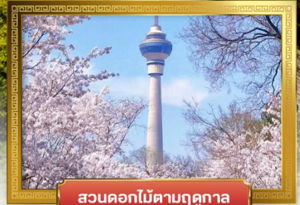
สวนดอกไม้ตามฤดูกาล