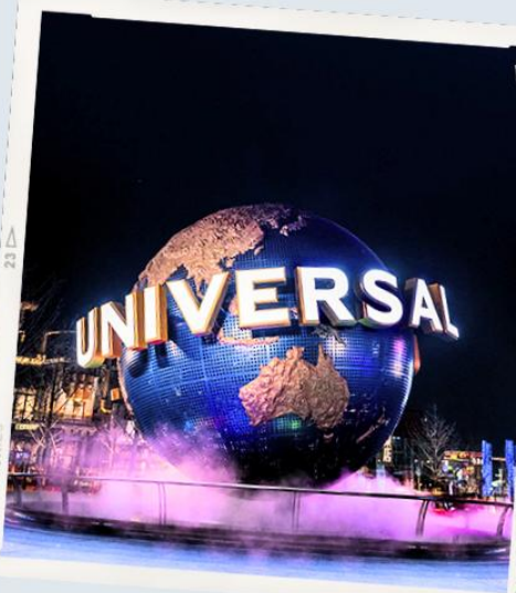
UNIVERSAL CITYWALK BEIJING