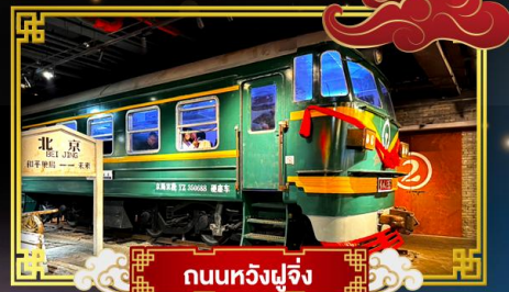
ถนนหัวงฝูเจิ้ง