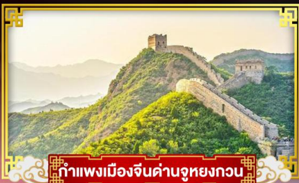
กำแพงเมืองจีนด่านจูหยงกวน

“ตะลุยสวนสนุกยูนิเวอร์แซล” ชมสิ่งมหัศจรรย์ของโลกกำแพงเมืองจีน