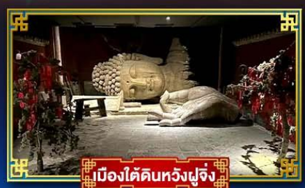
เมืองไถ่ดินหวังฟูจิ่ง

“กำแพงหิมะลิ้น” ...สิ่งมหัศจรรย์ของโลก พระราชวังต้องห้าม อดีตพระราชวังหลวงสุดยิ่งใหญ่