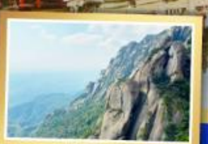
จากหลิงฮาน