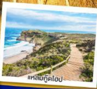
แหลมกู๊ดโฮป