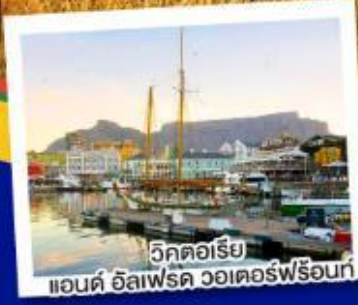
วิกตอเรีย แอนดริว อีลเฟรด วอเตอร์ฟร้อนท์