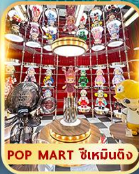
POP MART ซีเหมินติง