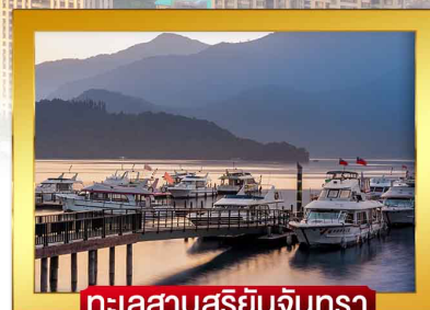
ทะเลสาบสุริยจันทร์