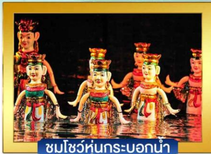
ชมโชว์หุ่นกระบอกน้ำ